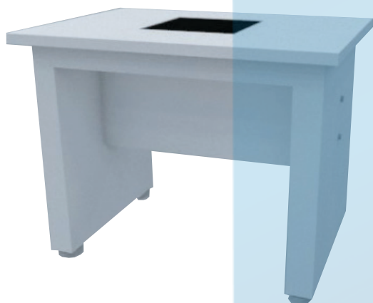
BAL1 - MESA DE BALANÇA 1