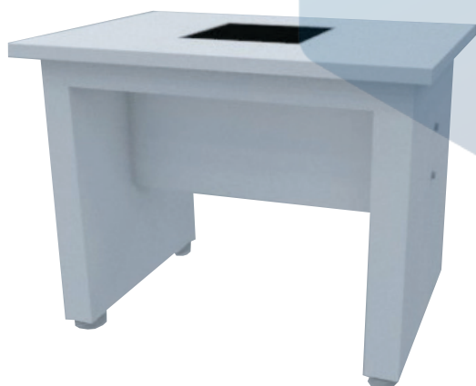
MESA ANTI-VIBRATÓRIA PARA MICROSCÓPIO